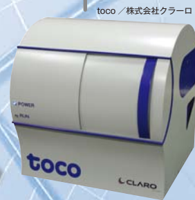
toco / 株式会社クラロ